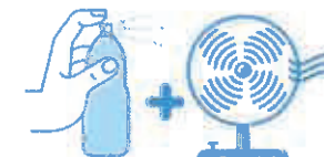
Je mouille mon corps et je me ventile