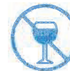
Je ne bois pas d'alcool