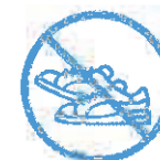
J'évite les efforts physiques