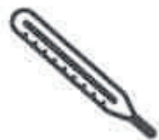
Fièvre > 38°C