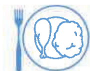
Je mange en quantité suffisante