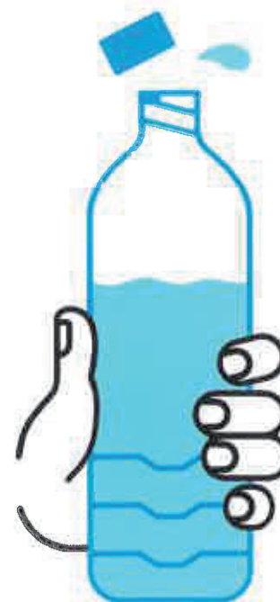
JE BOIS RÉGULIÈREMENT DE L'EAU