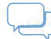
Je donne et je prends des nouvelles de mes proches