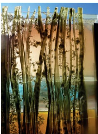
Superpositions, Isabelle Zéo